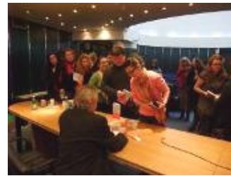
auteur in gesprek, signeren, presenteren op de universiteit, enthousiaste verkoop