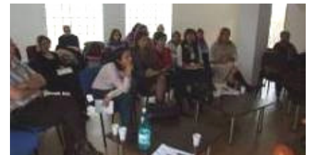
geïnteresseerde toehoorders in Boekarest

Naast de verdere ontwikkeling en verbinding van organisaties in Iași is ook een tweede bezoek aan Boekarest gebracht. Hier is een workshop georganiseerd door verschillende ouderverenigingen. Dertig mensen namen deel aan de workshop. De informatie is zeer goed ontvangen. Of de activiteiten in Boekarest worden voortgezet is afhankelijk van de projectfinanciering. Activiteiten in Boekarest vallen niet binnen het bestaande project.