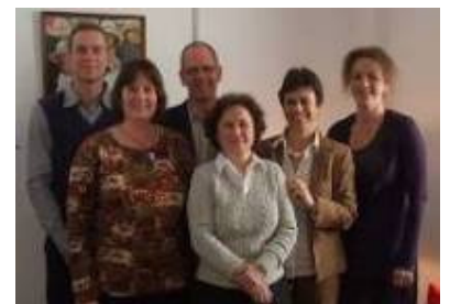
op bezoek bij mw. Tanya van Gool

De ambassadeur van Nederland HE Tanya van Gool heeft ons met zeer veel enthousiasme en hartelijkheid ontvangen op de ambassade. Ze zit pas sinds twee maanden op haar post in Roemenie. Het project sprak haar erg aan. Mw. van Gool is voornemens om de komende lesweek in maart een actief bezoek te brengen aan het project.