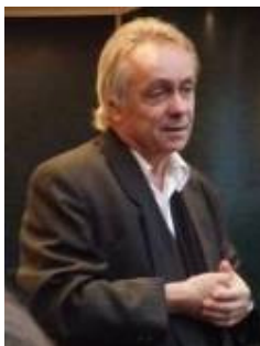
auteur Theo Peeters