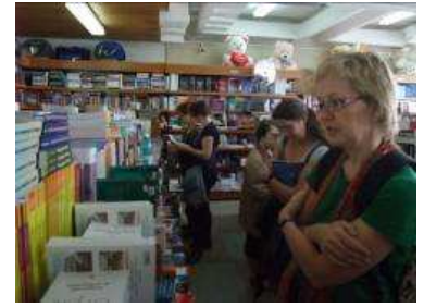
In een boekwinkel in Iasi op zoek naar boeken over autisme

Uitgever Polirom heeft het boek van Theo Peeters "Autisme: van begrijpen tot begeleiden" in november 2009 uitgegeven. Dit is een mijlpaal voor het project. We willen echter graag nog meer literatuur in het Roemeens beschikbaar maken. In een bijeenkomst met de uitgever hebben we hierover gesproken. In de zomer neemt een uitgever een besluit over het vervolg.