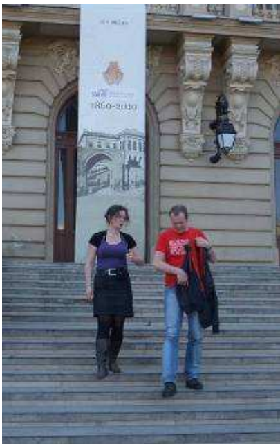
Foto impressie van de universiteitsactiviteiten