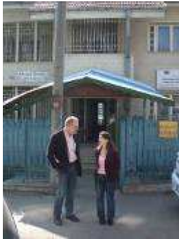
Werkbezoeken aan Stejarul en Galata