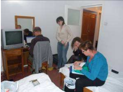
Lesvoorbereiding op de hotelkamer

In de vorige nieuwsbrief gaven we aan dat er plannen waren voor het maken van een informatie DVD over autisme. Door de complexe regelgeving hebben we dit plan aangepast. Momenteel verkennen we, samen met de Roemeense betrokkenen, de behoefte aan het ontwikkelen van een autisme website met een informatie DVD.