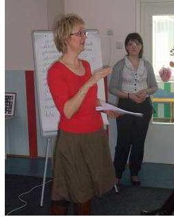
les over seksualiteit